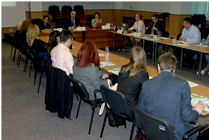
Comerț și Industrie, Camera de Comerț și Industrie a Serbiei și CCINA Constanța.

În zilele de 18 și 19 aprilie CCINA Constanța, a organizat două Evenimente de prezentare a activităților și rezultatelor realizate în cadrul proiectului ACTS , dedicate stakeholderilor și firmelor constănțene.